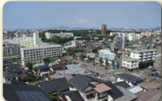
(共同部屋からの展望)